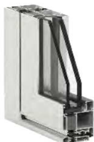
ALIPLAST Genesis 75 vchodové dveře